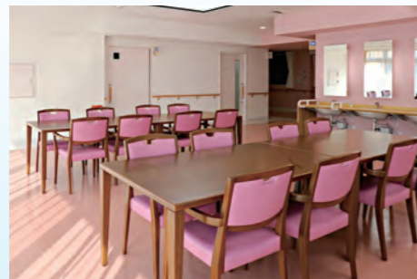
3階 食堂兼機能訓練室