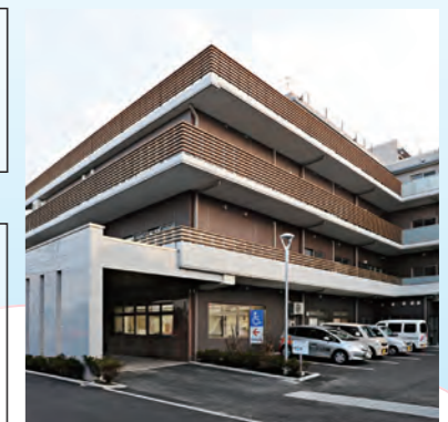
北西側外観(駐車場)