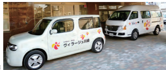
デイサービス専用車

要支援・要介護と認定された方に日帰りの利用による、介護や入浴・食事サービスを提供します。(定員30名)