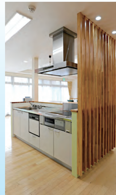
3階 共同生活室キッチン